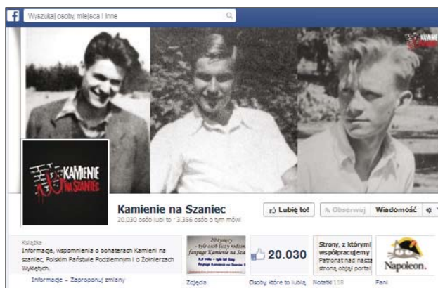
Rysunek 1. Kamienie na szaniec Aleksandra Kamińskiego na Facebooku